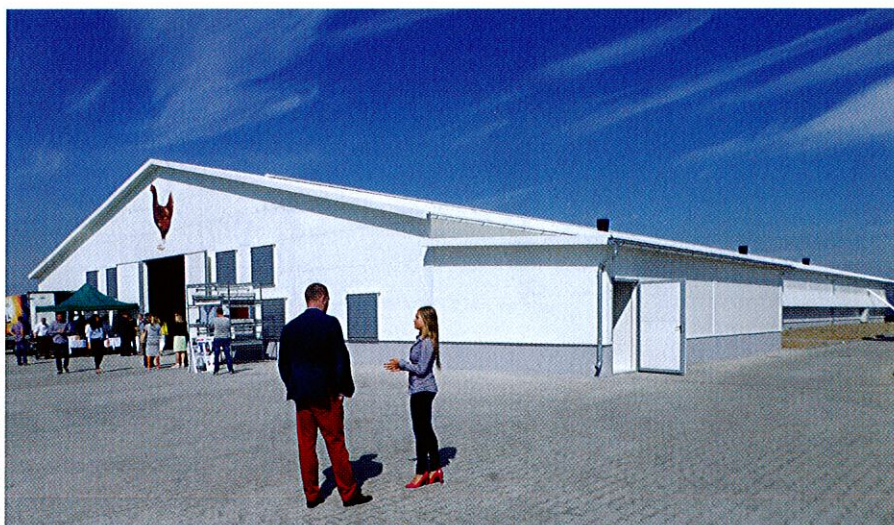
VERBEEK BROEDERIJ EN OPFOK

In Polen is omgeschakeld van traditionele kooien naar verrijkte kooien en beperkt naar voliërestallen. De opfok gebeurt nog vrijwel uitsluitend in kooien. „Pluimveehouders hebben gezien dat voliërohouderij om voliëro-pgefokte hennen vraagt. Van daar dat we deze stap hebben gezet.”